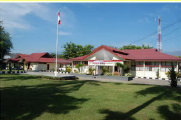
Palu-Eboni, Perwakilan Provinsi Sulawesi Tengah BPK RI sampai saat ini masih menempati tanah dan gedung milik Daryat Perbulunan dengan status penjam piala. Pada tahun 2010 nanti, diharapkan Perwakilan Provinsi Sulawesi Tengah sudah mempunyai tanah untuk pembangunan gedung kantor.