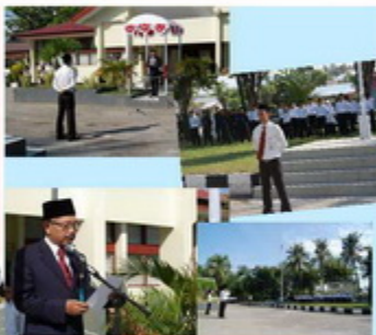
Upacara Hari Sumpah Pemuda Ke-81 Pemuda Bersatu, Indonesia Bangkit dan Maju

Dalam ikrar tersebut disebutkan bahwa sejak proklamasi kemerdekaan Republik Indonesia, telah banyak terjadi rongrongan baik dari dalam maupun luar negeri terhadap NKRI. Rongrongan tersebut dimungkinkan oleh karena kelengahan, kekurangwaspadan bangsa Indonesia terhadap kegiatan yang berupaya untuk menumbangkan Pancasila sebagai Ideologi Negara. Akan tetapi dengan semangat kebersamaan yang dilandasi oleh nilai-nilai luhur Ideologi Pancasila, bangsa Indonesia dapat memperkokoh tegaknya NKRI. (kur)