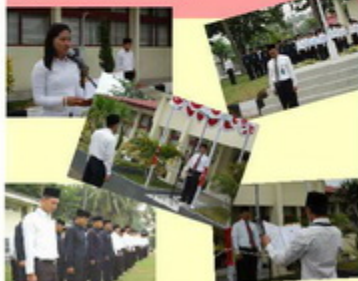
Upacara Peringatan Hari Kesaktian Pancasila Setia Pada Pancasila Demi Keutuhan NKRI

Triwulan keempat merupakan bulan yang padat dengan kegiatan upacara. Terhitung dari bulan Oktober s.d. Desember 2009, telah diselenggarakan empat kali upacara yaitu Hari Kesaktian Pancasila (1/10), Hari Sumpah Pemuda (28/10), Hari Pahlawan (10/11) dan Hari Korpri (30/11). Berikut ini laporan kegiatan upacara yang diselenggarakan Perwakilan Provinsi Sulawesi Tengah BPK RI selama triwulan keempat.