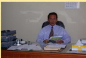
MUH. YASIR, S. E., M. M., Ak. "Jaga Integritas dan Independensi Sebagai Pemeriksa BPK"